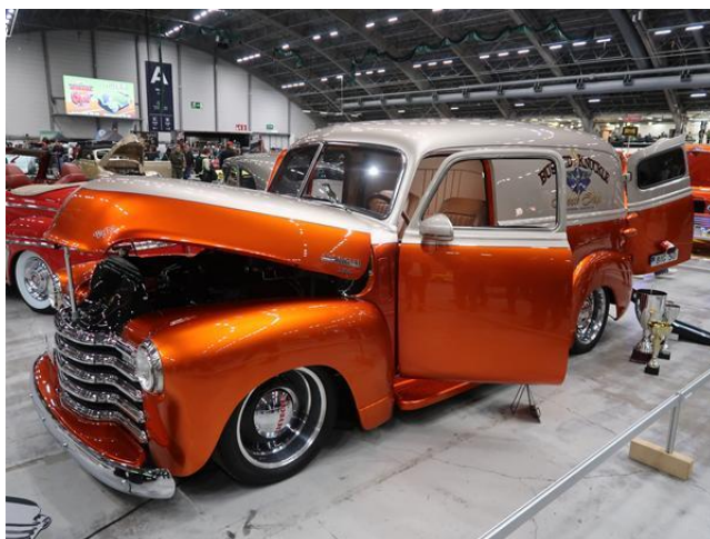
25. Chevrolet Panel Truck -50, Björn Torninger, Ruotsi